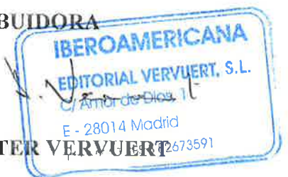
D. KLAUS DIETER VERVUERT