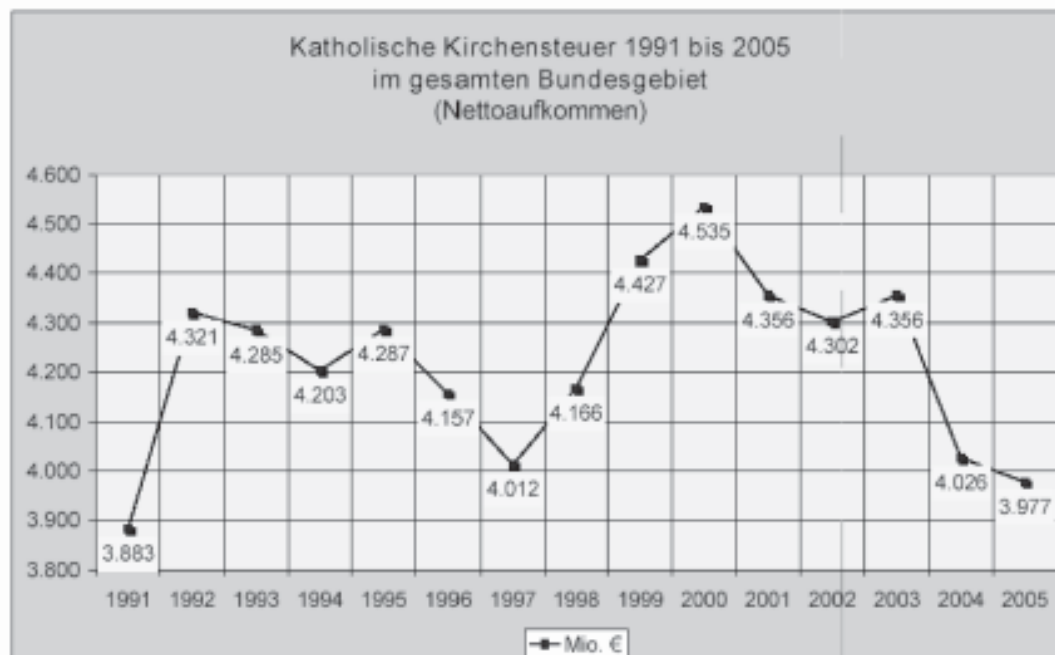
Gráfico del impuesto religioso de la Iglesia católica desde 1991 hasta 2005 en todo el territorio federal (Ingresos netos)