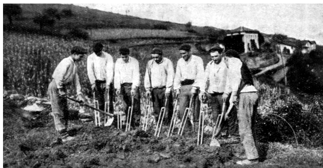
Imagen I. Layadores