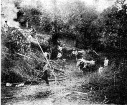
Imagen IV. Calero rústico

Hay pues un sustrato, un trasfondo creado sobre la realidad de las prácticas humanas (trabajo, vestimenta, utensilios, y otros muchos, claro), las necesidades de agrupamiento del hombre (identificación e identidad), etcétera, que anima unas herramientas creativas que, en momentos determinados, se convierten (o no) en símbolos identitarios de ciertas comunidades. No es cosa de proponer ninguna norma en la teoría de la representación, pero sí de sugerir vías de reflexión sobre los soportes y la complejidad de circunstancias sobre las que se construyen las representaciones. Otro tanto ocurre entre esta foto del mismo libro y la elaboración de Txiki (John Zabalo) 15 . Este juego que pudiera parecer casi pueril, reiterado en el arte culto, en la decoración, en los libros de divulgación, crea un orden entre la espera sin sorpresa y el hábito, una redundancia en las imágenes, la repetición simple y prevista, hasta formar un sistema armónico completo de representaciones (en el que se basa el poder del tópico).