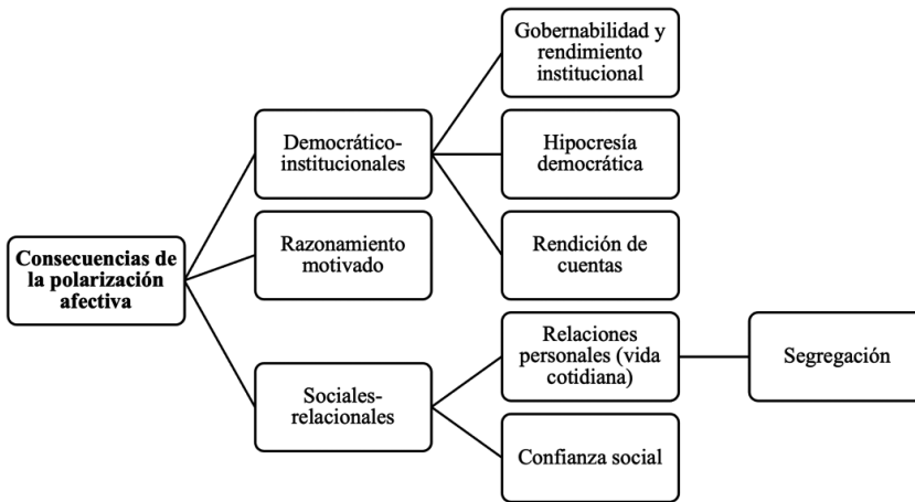
FIGURA 2. ESQUEMA RESUMEN DE LAS CONSECUENCIAS DE LA POLARIZACIÓN AFECTIVA

flexión sobre la evolución de la confianza social general, podemos comprender cómo la percepción de polarización dificulta la confianza en los demás al asumir que no se comparten valores fundamentales con buena parte de la población (Lee, 2022). Al ser percibidos los rivales como una amenaza, se debilitan los lazos comunitarios (Torcal y Thomson, 2023). En definitiva, nos volvemos ciudadanos más recelosos, prejuiciosos, encerrados en nuestra propia tribu y reducimos la conducta prosocial.